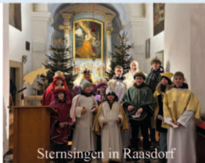
Sternsingen in Raasdorf