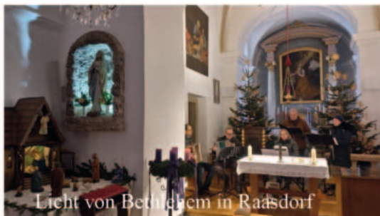
Licht von Bethlehem in Raasdorf