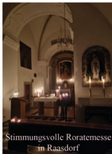
Stimmungsvolle Roratemesse in Raasdorf