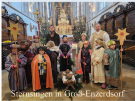
Sternsingen in Groß-Enzersdorf