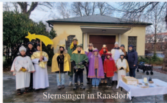
Sternsingen in Raasdorf

Danke an alle Spender, die bei der Sternsingeraktion am 4. bis 6. Jänner 2025 für die Weltmission in Afrika gespendet haben. Danke auch allen Kindern und Betreuern, dass sie fleißig unterwegs sind. Das ist ein Zeichen für Miteinander und Füreinander. Im Sinne des Evangeliums sollten wir hilfsbereit sein und uns gegenseitig unterstützen, auch in unseren Familien und unserem Alltag.