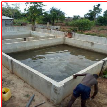
Eines der beiden durch die Spenden errichtete Fischzuchtbecken